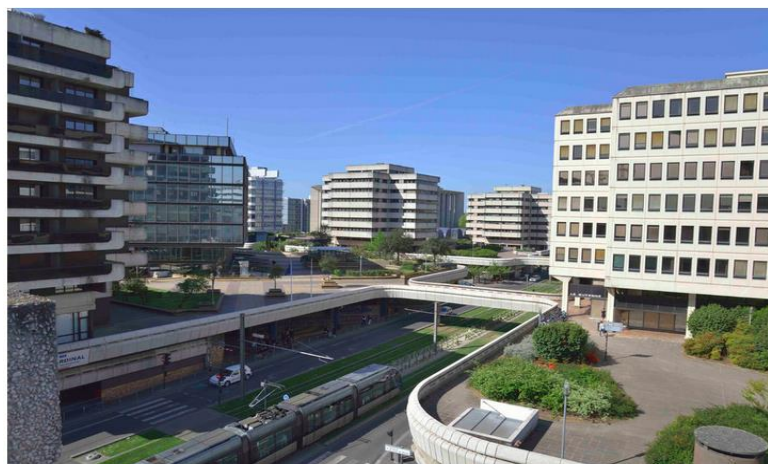
Une vue d'ensemble du quartier rénové de Mériadeck

À cette liste non exhaustive, il faut ajouter les écoles primaires et maternelles, une Centrale géothermique et un Central téléphonique, l'ancienne Caisse d'Épargne, des hôtels (le dernier en date a ouvert au mois de janvier) et des logements (environ 2500 personnes) !