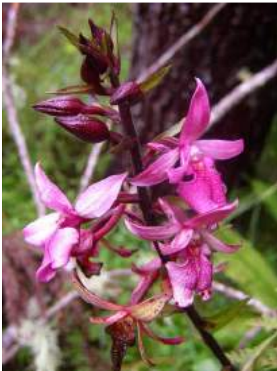
Orchis à fleurs lâches

-Angélique à fruits variables ( Angelica heterocarpa )