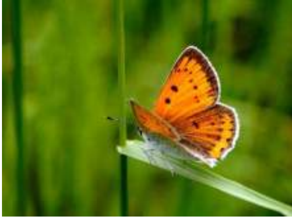
Cuivré des marais