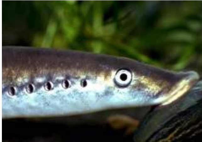
Lamproie de Planer

Tous les indices montrent que l'espèce est en voie de régression ou de disparition ; elle est due à la pêche importante de l'anguille à tous les stades biologiques au niveau européen, ainsi qu'à la présence d'obstacles lors de sa migration.