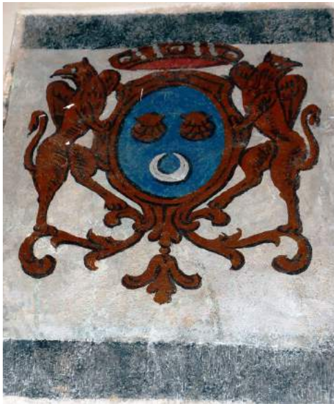
Armoiries de Montesquieu côté sud , restaurées en 2009