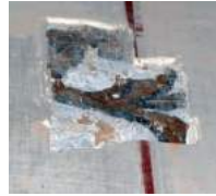
Élément d'armoiries ...à déga- ger sous le badigeon en 2018